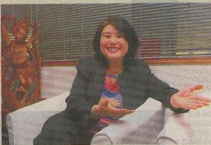
文 王辉雯

“我们一般说话速度比较快，字与字相连，尾音也较为模糊。我认为，除了重视说标准英语，我们也应该放慢说话的速度，发音也要清楚。”——刘传慧